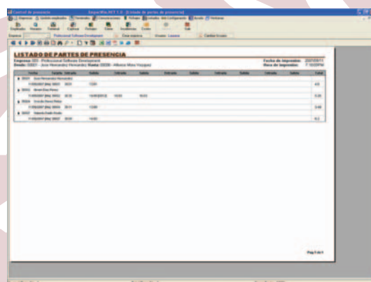
Listados de Fichajes